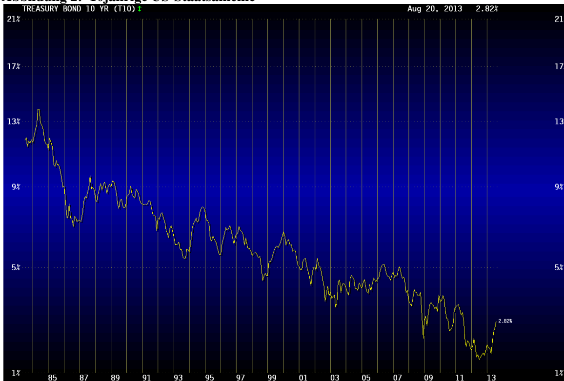
Abbildung 2: 10jährige US-Staatsanleihe